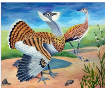
Рис. Роговой Ксении

Объявляя очередной конкурс детского рисунка экологической направленности, сотрудники отдела экологического просвеще-